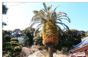
【百段坂を下ると少林寺】 フェニックスの名木の向うに険しい三方ヶ原台地の側面を望むことができます