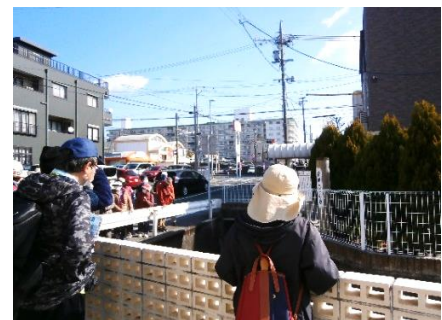
【新川水源の地】 坂を上がると聖隷浜松病院のヘリポートが見えます