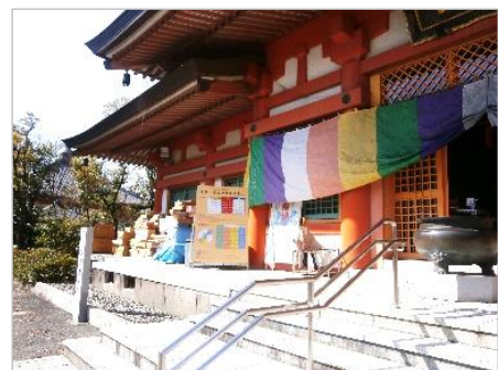
【遠州信貴山本殿】 供養待ちのお雛様の段ボール箱がいっぱいでした