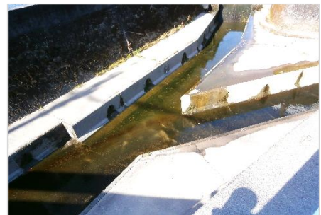
犀ヶ崖・新川合流地点