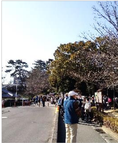
スタート前の長蛇の列

スタート予定の9時前には大勢の参加者で長蛇の列となり、体調等の質問票回収・マスク着用確認等のコロナ感染予防対策後、8時45分に第1グループが出発。その後随時出発しました。