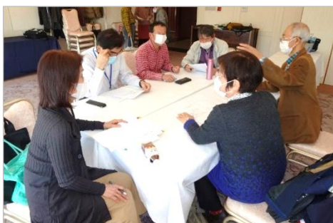
配属先のブロック長から説明を受ける

座学終了後に法被と帽子の採寸を行った後、配属先のブロック長から、受け入れに当たり各ブロックでの定例会等の説明がされました。