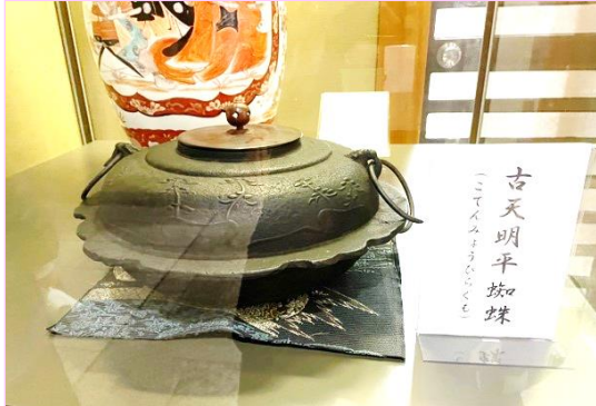
古天明平蜘蛛の展示品

ひょんなことから古天明平蜘蛛が館山寺温泉の開華亭に有るとの情報を得て心躍らせ会いに行った。開華亭のフロントでドキドキしながらも「古天明平蜘蛛を見せていただきたいのですが」と告げると、まるで待っていましたとばかりに「はいどうぞ、沢山の方がお見えになっていらっしゃいますよ」とのこと。ウッソー。そんなに沢山の方が見に来ているの？みんなどこから情報を得たの？人より遅れをとったことが悔しい。