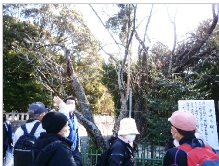
【白山神社の子持ち桜】 桜の木の幹に竹が共生しています